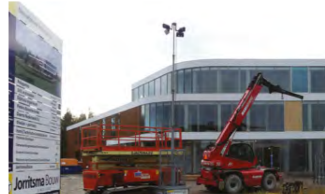
NIEUWBOUW POLYGANICS ZERNIKECOMPLEX

Door de bovenstaande ontwikkeling groeit de onderlinge verbondenheid in de regio. De steden worden een steeds belangrijker werkgever en de omliggende gemeenten zijn een onmisbare factor in het voorzien van voldoende (gekwalificeerd) personeel. De balans tussen steden en de omliggende gemeenten wordt daarmee nog belangrijker en intensiever. Het belang van goede bereikbaarheid van de steden neemt toe en de vraag naar aantrekkelijke woonvoorzieningen en recreatiemogelijkheden in de omliggende regio groeit.