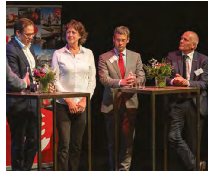
BESTUURDERS IN DISCUSSIE TIJDENS RGA-CONGRES 'DE KRACHT VAN REGIONALE SAMENWERKING' IN DE NIEUWE KOLK IN ASSEN

De RGA is hiervoor het overleg- en afstemmingsplatform. We werken samen op basis van gelijkwaardigheid, met oog voor elkaars deelopgaven en respect voor elkaars belangen. We maken hierbij keuzes die het beste zijn voor de regio als geheel. We doen dit niet alleen, maar in samenwerking met het maatschappelijk middenveld, bedrijven, instellingen en stakeholders.