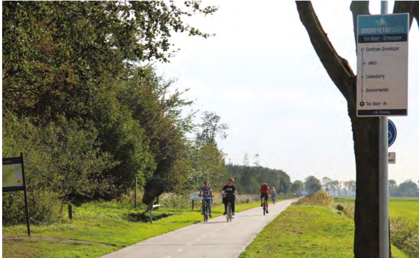
DOORFIETSRUTE TEN BOER