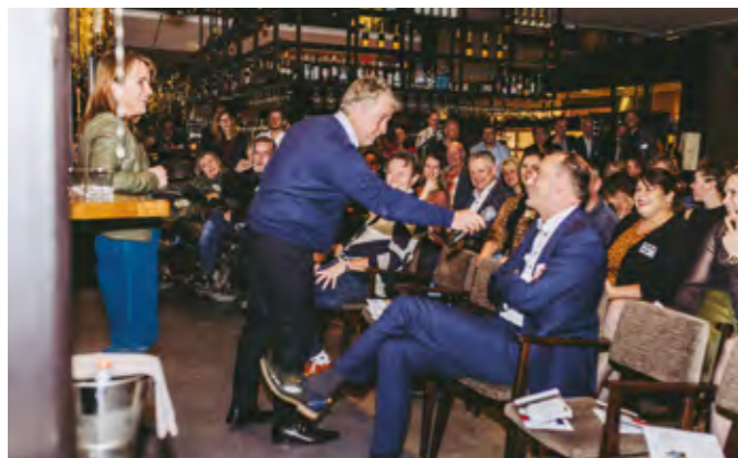
BIJENKOMST ECONOMISCH PLATFORM 'GASTVRIJHEID LOONT!'

Deelnemers spraken unaniem hun lof uit over de regionale samenwerking onder de vlag van de RGA, zo bleek uit de Evaluatie. De meerwaarde voor de regio zit - aldus de ondervraagden - met name in de hiervoor genoemde concrete resultaten die geboekt zijn. De deelnemers spraken zich ook uit voor een meer agenderende en signalerende rol van de RGA. De Evaluatie is in de Stuurgroep van oktober 2018 vastgesteld als uitgangspunt voor de Actualisatie. Belangrijke opmerking was om binnen het thema Ruimtelijke Kwaliteit de slag te maken van planvorming naar concrete projecten.