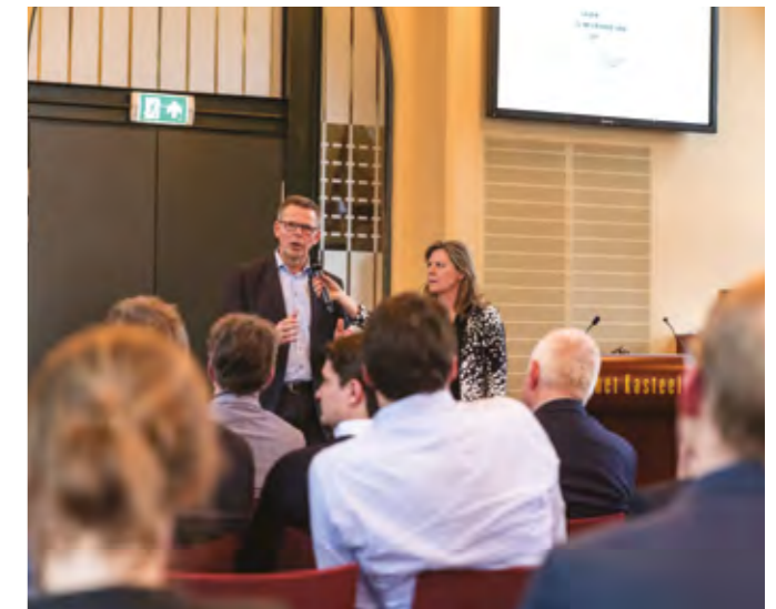
BIJEENKOMST ECONOMISCH PLATFORM 'BEDRIJF ZOEKT TALENT'