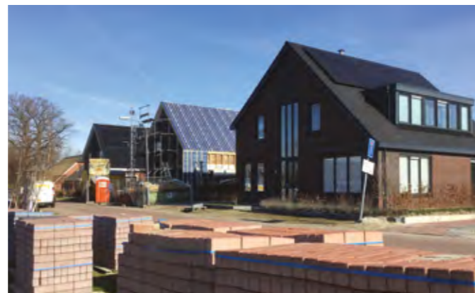
GROOTE VEEN EELDE