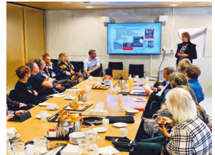
BIJEENKOMST RADEN EN STATEN GEMEENTEHUIS TYNAARLO