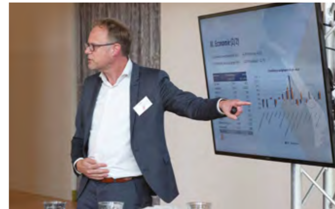
RGA-CONGRES 'DE KRACHT VAN REGIONALE SAMENWERKING'