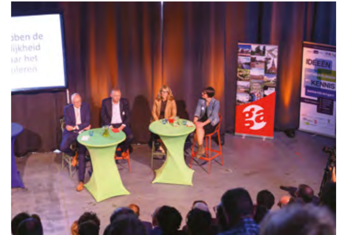
FIETSCONGRES HEALTH HUB RODEN

Vooraf op het gebied van infrastructuur zijn dankzij de samenwerking in de RGA concrete resultaten bereikt: er ligt nu een netwerk van P+R-locaties rond de steden, er is een fietspadennetwerk in aanleg met doorfietsroutes en een fietssnelweg, de reizigersaantallen voor 2040 zijn dankzij het hoogwaardig OV-netwerk nú al gehaald en investeringen in diverse treinstations hebben de regio uitstekend bereikbaar gemaakt. Regionale samenwerking heeft verder geleid tot kwalitatieve en kwantitatieve afstemming van woningbouw en bedrijventerreinen. Zo zijn we elkaars partners geworden in plaats van elkaars concurrenten en konden we verliezen beheersbaar houden. De RGA functioneert bovendien als een goed netwerk. Bestuurders, raads- en Statenleden, ambtenaren en stakeholders komen elkaar regelmatig tegen tijdens congressen, bijeenkomsten van het Economisch Platform of aan een van de vergadertafels van de RGA. De gunfactor binnen de RGA is groot. Want als het bij de burens regent, druppelt het hier ook. Verder kijken dan het eigen gemeentelijk of provinciaal belang leidt uiteindelijk tot een sterkere regio en daar worden alle deelnemers beter van. En last but not least: de RGA werkt als verdubbelaar van investeringen. In de afgelopen 22 jaar zijn er 200 projecten uitgevoerd, is er gezamenlijk zo'n 135 miljoen euro in het Regiofonds gestort waarmee een investeringsbedrag van 700 miljoen euro is uitgelokt.