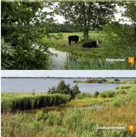
Uitsnede uit De Hunzevisie 2030