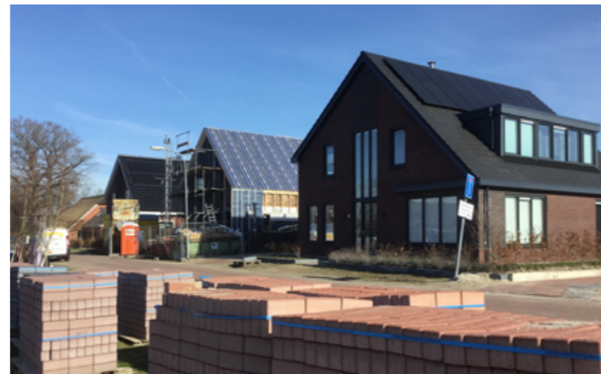
GROOTE VEEN EELDE