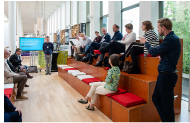
RGA WORKSHOP WONEN