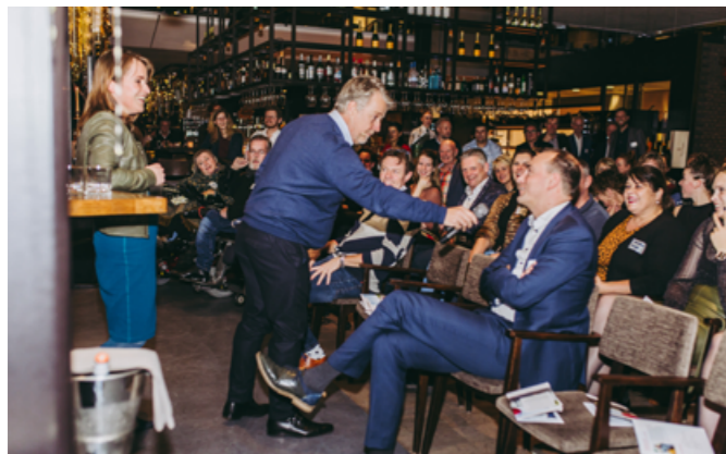
BIJENKOMST ECONOMISCH PLATFORM 'GASTVRIJHEID LOONT!'