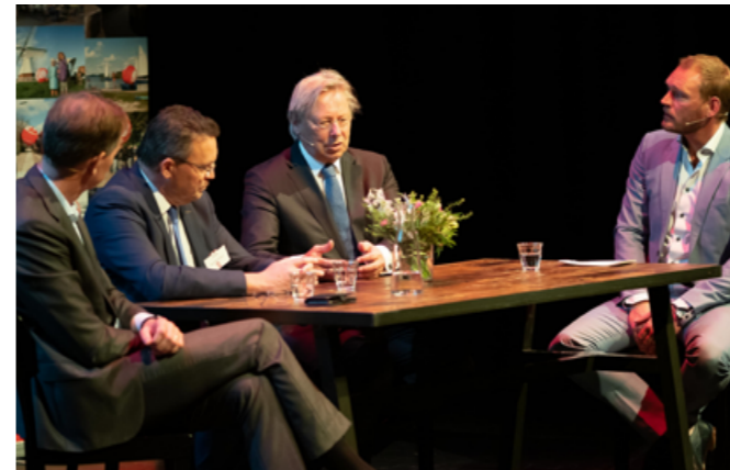
RGA-CONGRES 'DE KRACHT VAN REGIONALE SAMENWERKING'