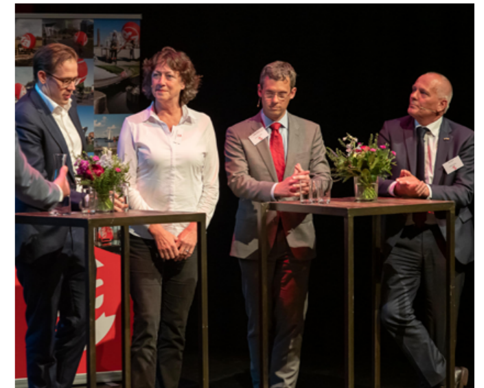
BESTUURDERS IN DISCUSSIE TIJDENS RGA-CONGRES 'DE KRACHT VAN REGIONALE SAMENWERKING' IN DE NIEUWE KOLK IN ASSEN

De RGA is hiervoor het overleg- en afstemmingsplatform. We werken samen op basis van gelijkwaardigheid, met oog voor elkaars deelopgaven en respect voor elkaars belangen. We maken hierbij keuzes die het beste zijn voor de regio als geheel. We doen dit niet alleen, maar in samenwerking met het maatschappelijk middenveld, bedrijven, instellingen en stakeholders.