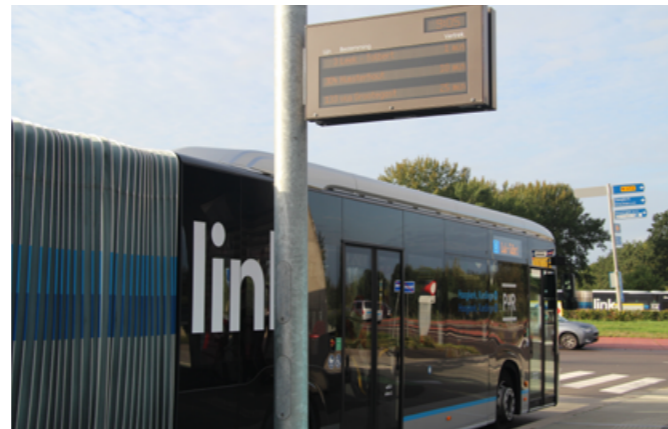
BUSHALTE MET DRIS-BORD P+R HOOGKERK