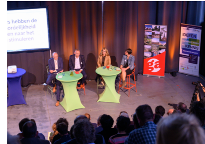
FIETSCONGRES HEALTH HUB RODEN

De RGA heeft een belangrijke functie wat betreft bedrijventerreinen en woonlocaties. Deze worden gemonitord en nieuwe initiatieven worden afgestemd. Als eerste regio in Nederland maakte de RGA in 2012 afspraken hierover in het regionaal instemmingsmodel voor de woningbouw- en bedrijventerreinen. Het succes van dit model heeft zich bewezen in 2013. Toen de economie het tij tegen had, hebben de samenwerkende overheden binnen de RGA 200 van de 600 hectare bedrijventerrein weten af te boeken. Ieder voor zich was dit niet gelukt: de pijn werd samen verdeeld.