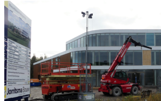
NIEUWBOUW POLYGANICS ZERNIKECOMPLEX

Door de bovenstaande ontwikkeling groeit de onderlinge verbondenheid in de regio. De steden worden een steeds belangrijker werkgever en de omliggende gemeenten zijn een onmisbare factor in het voorzien van voldoende (gekwalificeerd) personeel. De balans tussen steden en de omliggende gemeenten wordt daarmee nog belangrijker en intensiever. Het belang van goede bereikbaarheid van de steden neemt toe en de vraag naar aantrekkelijke woonvoorzieningen en recreatiemogelijkheden in de omliggende regio groeit.