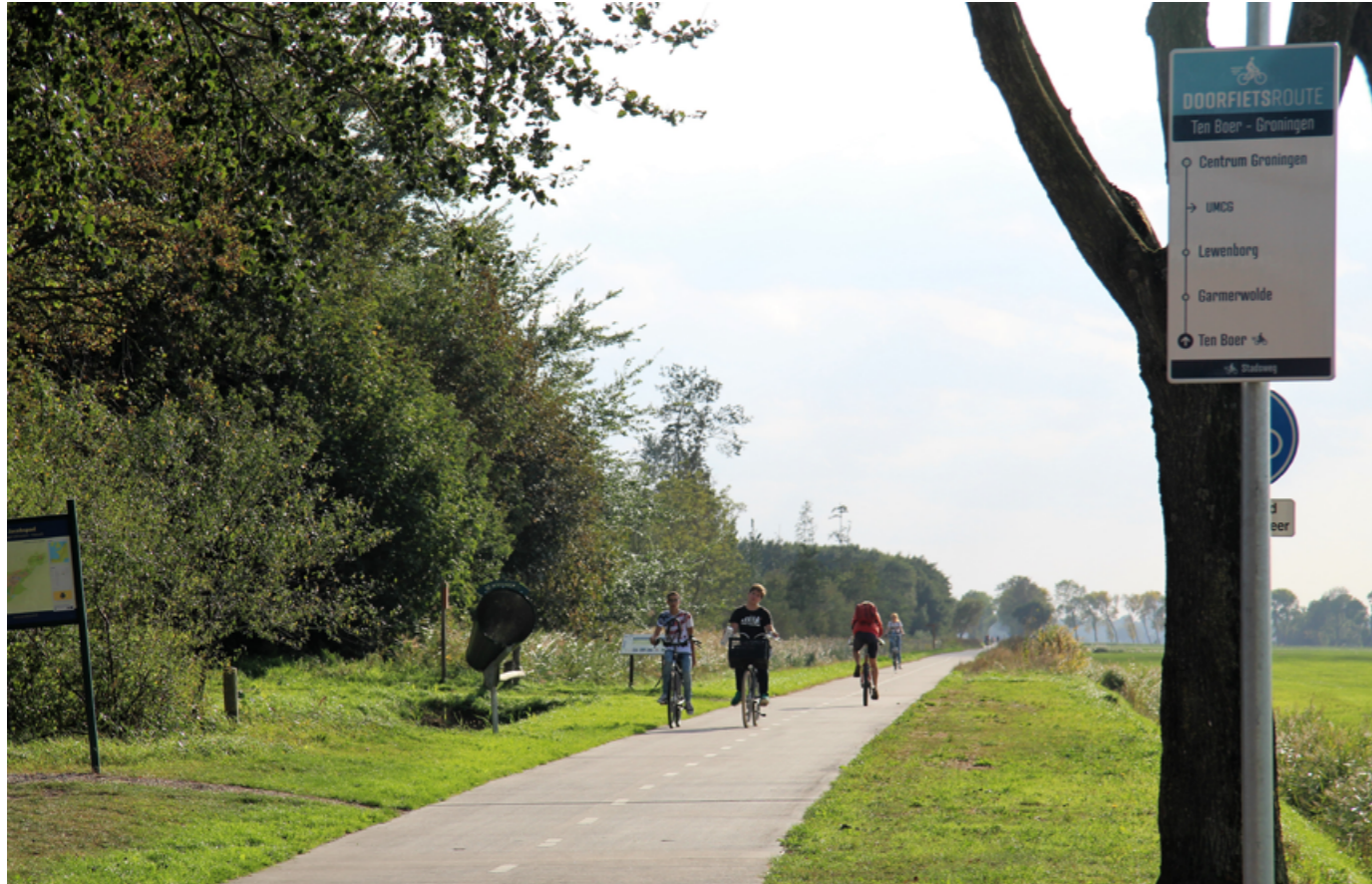
DOORFIETSRUTE TEN BOER