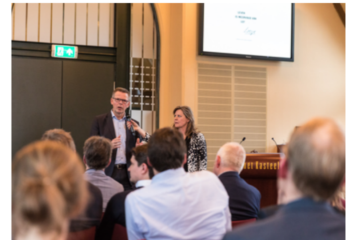
BIJENKOMST ECONOMISCH PLATFORM 'BEDRIJF ZOEKT TALENT'

afstemming van woningbouw en bedrijventerreinen. Zo zijn we elkaars partners geworden in plaats van elkaars concurrenten en konden we verliezen beheersbaar houden. De RGA functioneert bovendien als een goed netwerk. Bestuurders, raads- en Statenleden, ambtenaren en stakeholders komen elkaar regelmatig tegen tijdens congressen, bijeenkomsten van het Economisch Platform of aan een van de vergadertafels van de RGA. De gunfactor binnen de RGA is groot. Want als het bij de burens regent, druppelt het hier ook. Verder kijken dan het eigen gemeentelijk of provinciaal belang leidt uiteindelijk tot een sterkere regio en daar worden alle deelnemers beter van. En last but not least: de RGA werkt als verdubbelaar van investeringen. In de afgelopen 22 jaar zijn er 200 projecten uitgevoerd, is er gezamenlijk zo'n 135 miljoen euro in het Regiofonds gestort waarmee een investeringsbedrag van 700 miljoen euro is uitgelokt.